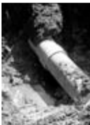
Una canonada que ha quedat petita

► Col·lector que va vessar l'agost del 2008